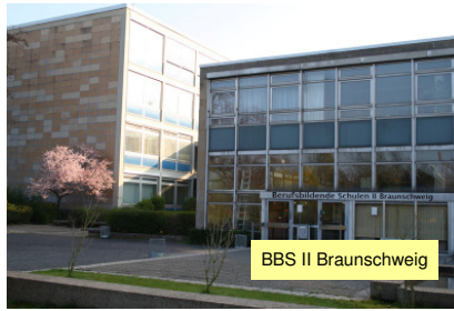
BBS II Braunschweig