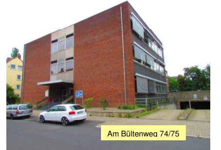
Am Büldenweg 74/75